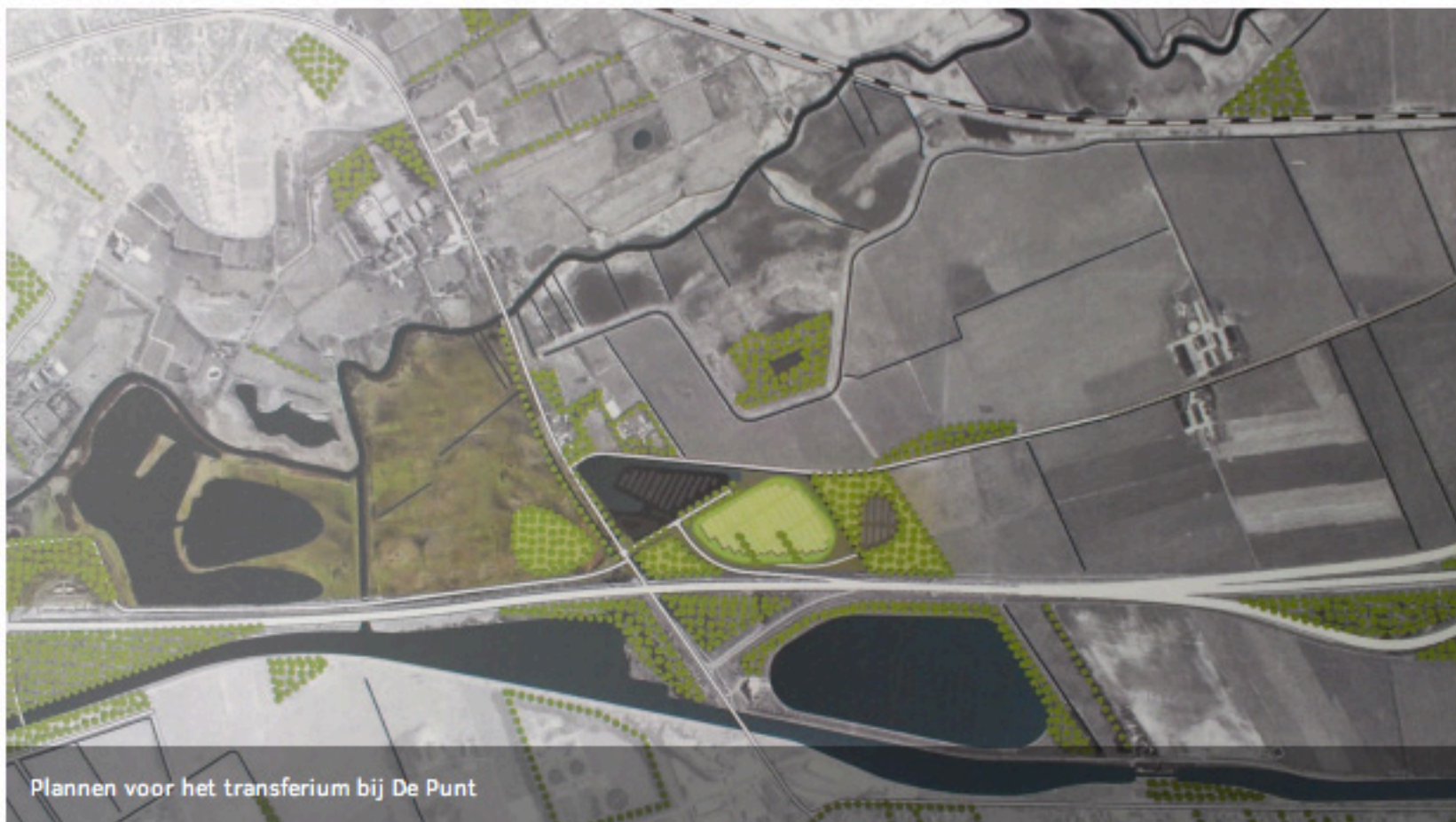
Plannen voor het transferium bij De Punt